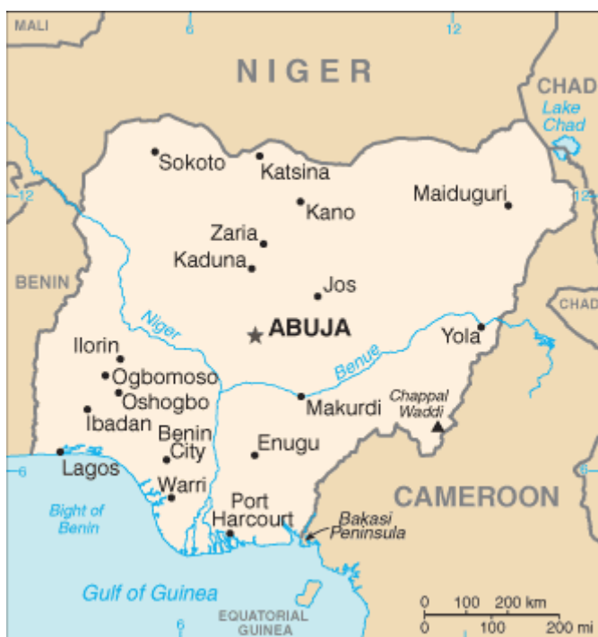
Mapa de Nigèria

S'ha donat inici a la sessió amb la presentació de les participants; cadascuna va dir el seu nom al grup ja que, encara que totes es coneguessin entre elles, algunes no sabien els noms de les altres. De seguida, i per mitjà de la visualització del mapa de Nigèria, les dones han dit de quina ciutat i Estat eren oriündes.