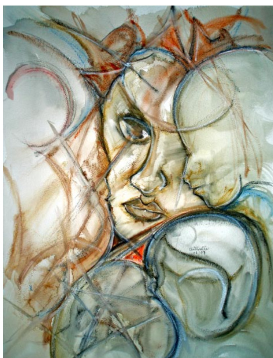
Impossible Dreams De la pintora nigeriana Chinwe Uwatse